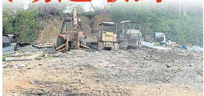
■以士拉央市议会为首的联合取缔大队，充公了非法垃圾场的泥机车等工具。

(士拉央28日讯) 不法之徒恶习不改，再次占用双溪杜亚乌鲁音路充作非法垃圾场，终于遭士拉央市议会、鹅麦县土地局及警方出动联合取缔，当场充公了工具等物品！