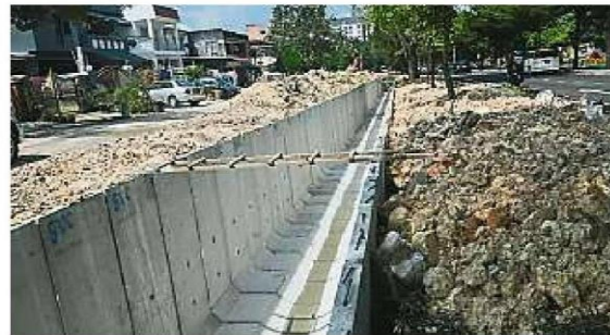
太子園布爾珍峇卡2路大溝提升工程完成后，有助于解决水灾问题。