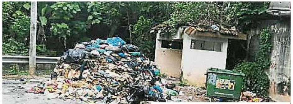
↑万撓嶺2商业区前的垃圾房被不知名人士丢出一座垃圾山，发出恶臭让商贩大为不满。

“我们认为乱丢垃圾固然是不对，但不管是谁丢的，士拉央市议会均应该协助我们清理垃圾。在冠病疫