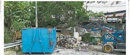
→士拉央市议会已派出神手“铲走”垃圾山，使投诉圆满解决。

情笼罩下，本就十分不景气的经济如今是百上加斤，这种垃圾山的出现会进一步影响我们的生意。”