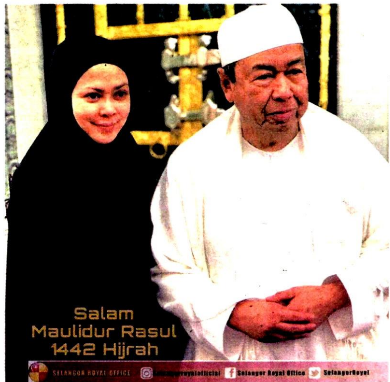
GAMBAR Sultan Sharafuddin bersama Permaisuri Selangor, Tengku Permaisuri Norashikin di Masjid Nabawi, Madinah ketika menunaikan umrah pada 2018 yang dimuat naik di Facebook Selangor Royal Office semalam.

khalifah kepada sekalian umat yang mengajar manusia tentang persaudaraan, akhlak yang mulia serta erti kehidupan yang sebenarnya.