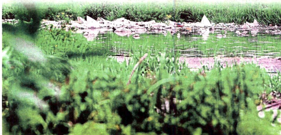
LONGGOKAN sampah dapat dilihat jelas terapung pada permukaan sungai yang dibuang individu tidak bertanggungjawab ketika tinjauan di Sungai Batang Benar, Nilai, Oktober lalu. Kementerian Alam Sekitar dan Air dalam kenyataannya berkata, kawasan belukar di pinggir kawasan industri di Jalan Emas, Kawasan Perindustrian Nilai dikenal pasti sebagai lokasi utama punca pencemaran yang menyebabkan loji rawatan air (LRA) Sungai Semenyih dihenti tugas.

Susulan itu, tiga lelaki berumur 30-an hingga 40-an ditahan di Kota Bharu, Kelantan dengan dua daripadanya ditahan pada 6 Oktober dan 12 Oktober lalu bagi membantu siasatan kes mengikut Seksyen 430 Kanun Keseksaan.