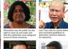
Mervaisah says the public has the right to clean air and water and that the authorities must safeguard access to these resources.