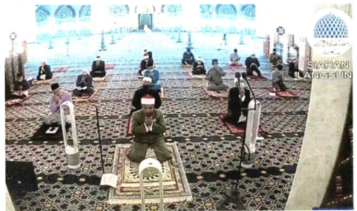
Paparan video melalui Facebook live Majlis Sambutan Maulidur Rasul Peringkat Negeri Selangor di Masjid Sultan Salahuddin Abdul Aziz Shah, Shah Alam, malam tadi.

"Baginda Rasulullah adalah khalifah kepada sekalian umat yang mengajar manusia mengenai persaudaraan, akhlak mulia serta erti kehidupan sebenarnya," titah baginda.