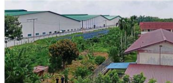
The presence of a paper processing factory (left) close to the Taman Bahi housing area in Berling, Selangor, has called into question the interpretation of the minimum distance for industries. — Farid