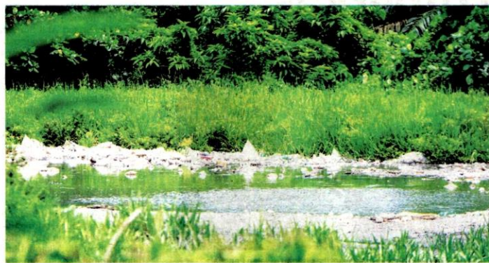
GAMBAR fail menunjukkan pencemaran Sungai Batang Benar di Nilai pada 5 Oktober lalu.

mampu memberi kesan buruk kepada alam sekitar yang boleh menyebabkan pokok serta tumbuh-tumbuhan mati sekiranya