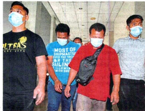
DUA lelaki (baju biru dan merah) yang disyaki terabit dalam kes pencemaran Sungai Batang Benar, Nilai ditahan Oktober lalu bagi membantu siasatan.