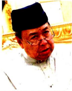
SULTAN SHARAFUDDIN IDRIS SHAH